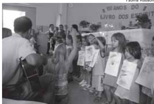
Evangelização infantil em apresentação alusiva aos 150 anos

cias versaram sobre o conteúdo da obra basilar da Doutrina, uma das mais vendidas até hoje, pois contém o cerne da Filosofia Espírita, constituindo-se numa enciclopédia de conhecimento humanista, numa visão evolutiva e transcendente, capaz de levar pessoas à renovação de atitudes e à mudança de hábitos.