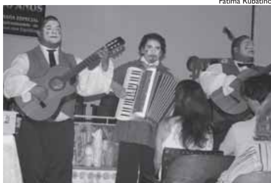
Cia de Teatro Laboro durante apresentação teatral de “As Mesas Girantes”

Entre 15 e 21 de abril, o Grupo Scheilla comemorou os 150 anos de O Livro dos Espíritos , data que corresponde ao surgimento da Doutrina Espírita, com Allan Kardec. O Grupo fez parte das comemorações mundiais, realizando uma série de conferências, apresentações teatrais e uma Feira do Livro. As conferên-